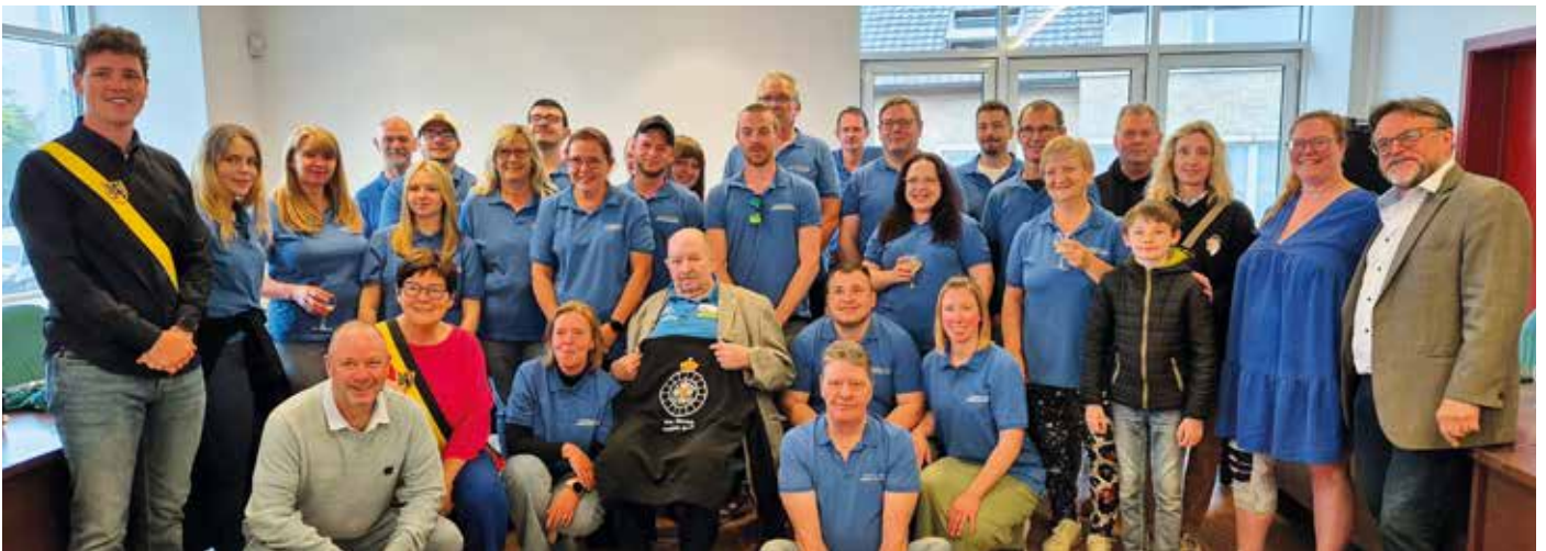
100 jaar bestaan Véloclub. Het loopt op wieltjes...