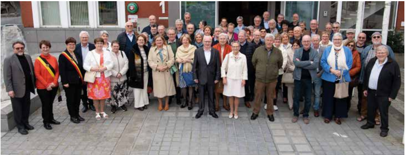
Alle 70-jarigen bijeen aan het gemeentehuis!