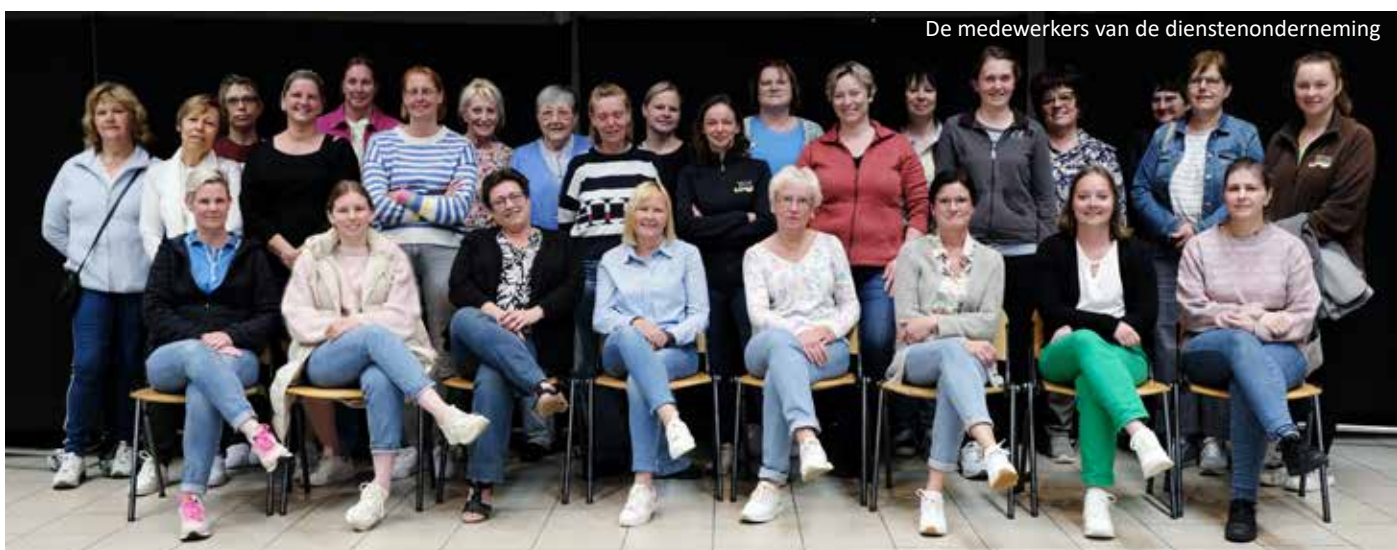
De medewerkers van de dienstonderneming