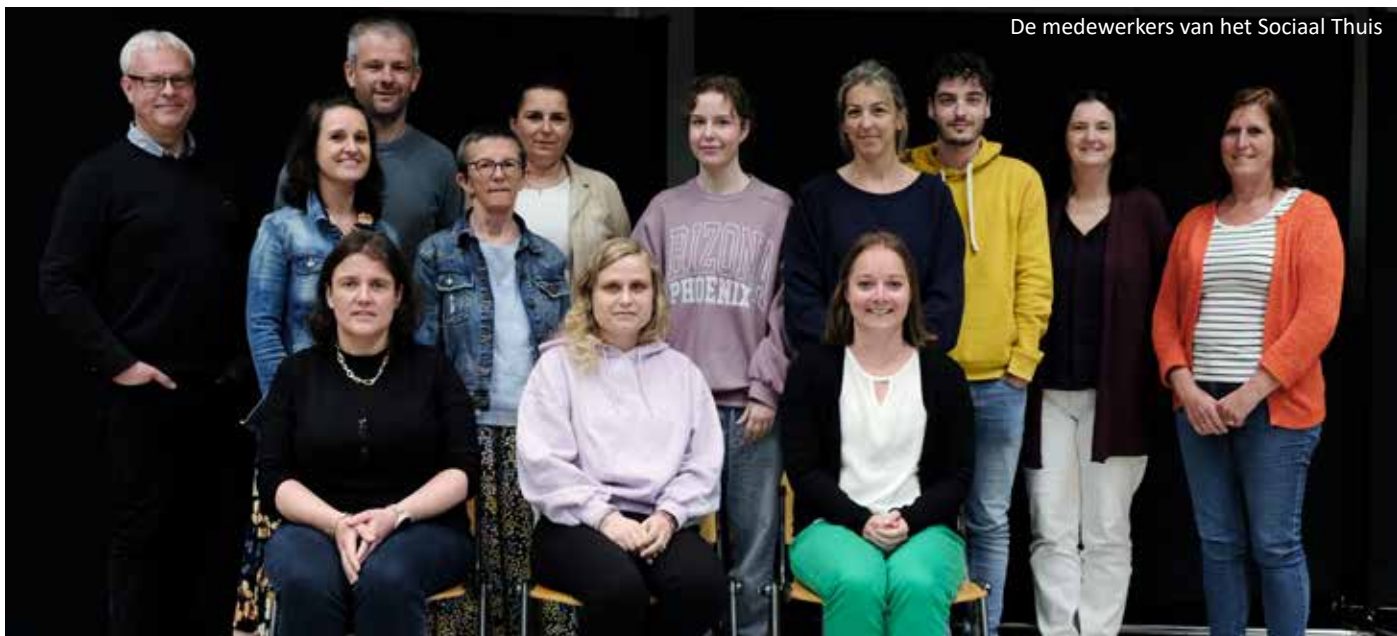
De medewerkers van het Sociaal Thuis