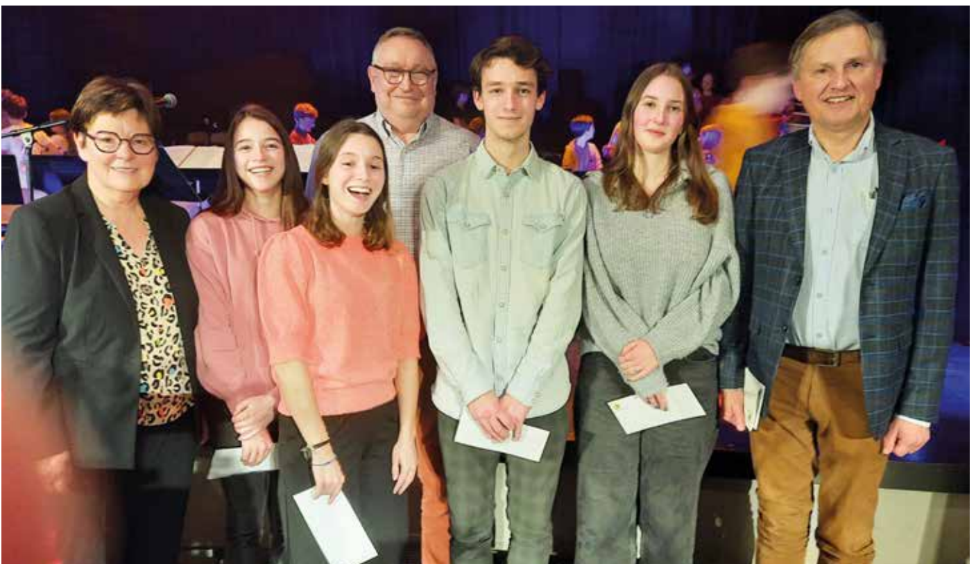
Laureaten Art'iz. Lendeledede is en blijft kunstzinnig bezig!