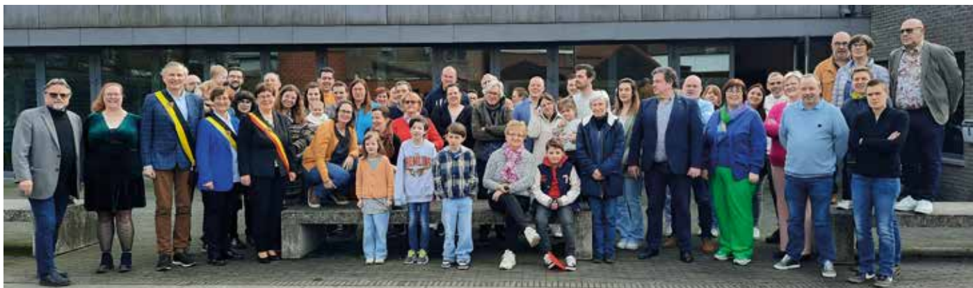
Ontbijt nieuwe inwoners. Altijd een belangrijk moment van kennismaking en zich thuis voelen.