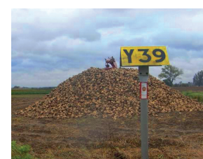
Meer dan 2 ton/m 2 stapelen