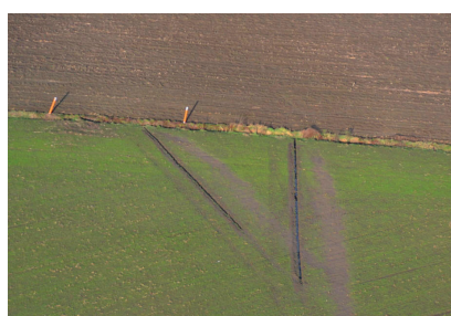
Tijdelijke geulen maken