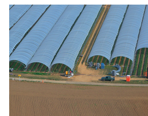
Serres, stallen, hangaars bouwen