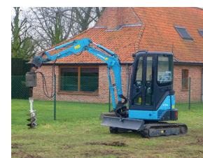
Gaten boren voor beplanting of omheining