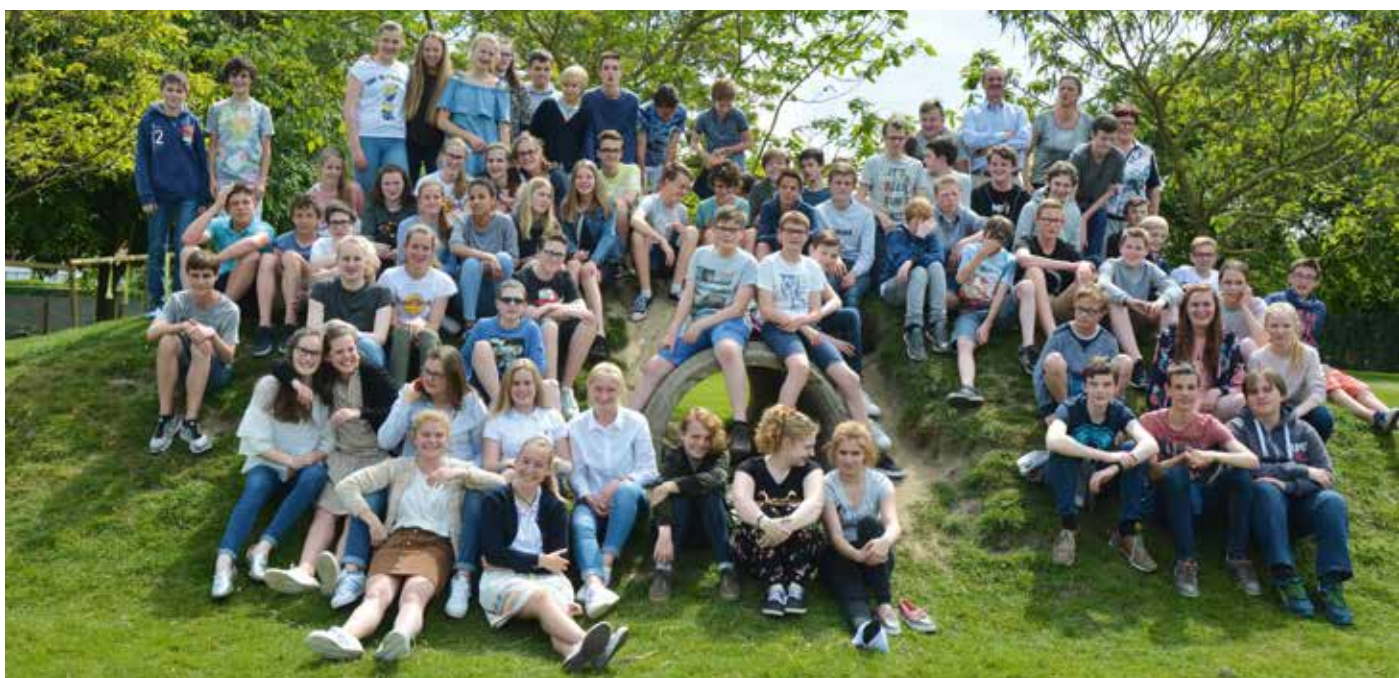
Rookvrije klassen middenschool Prizma (22 mei 2017)