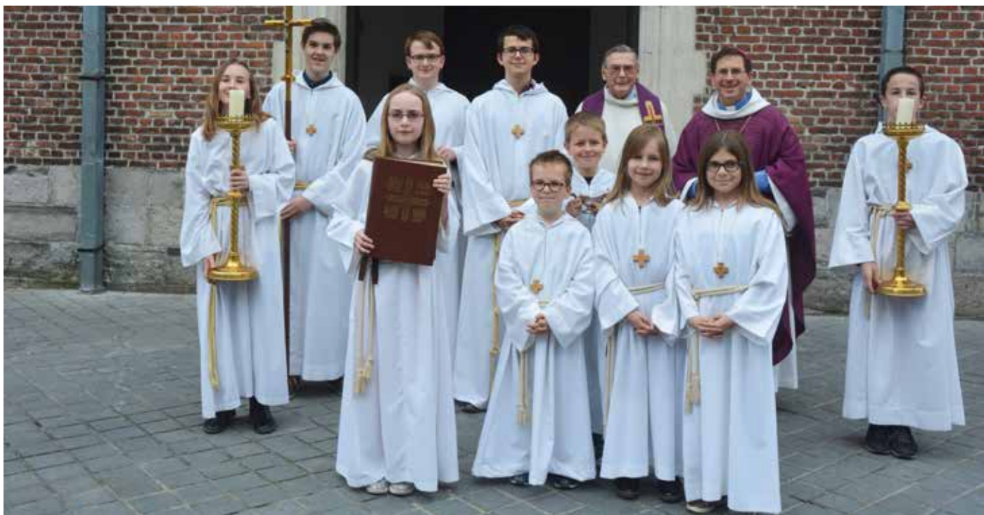
West-Vlaamse Accolietendag (1 april 2017)