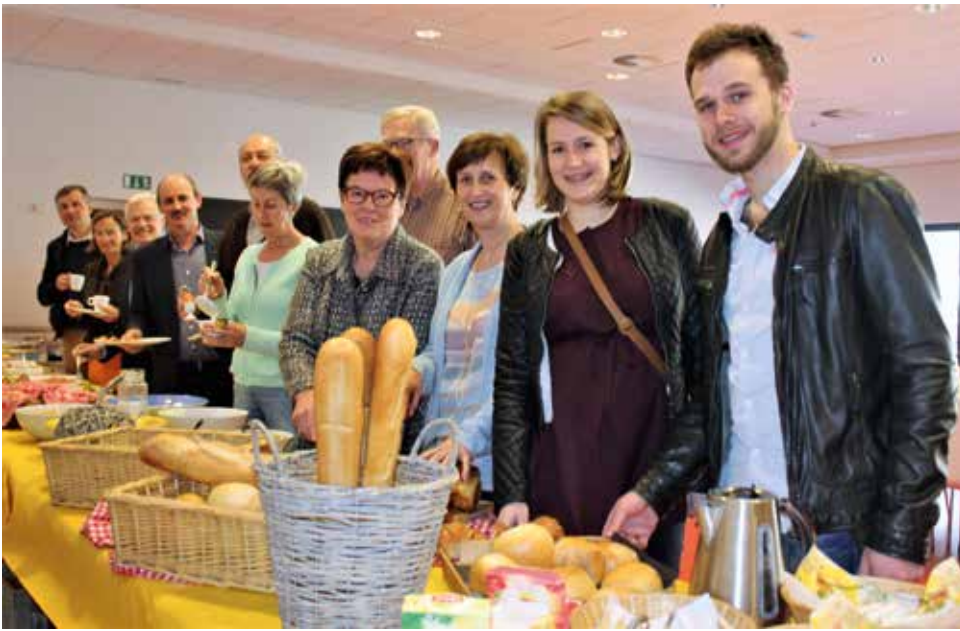
Ontbijt nieuwe inwoners (25 maart 2017)