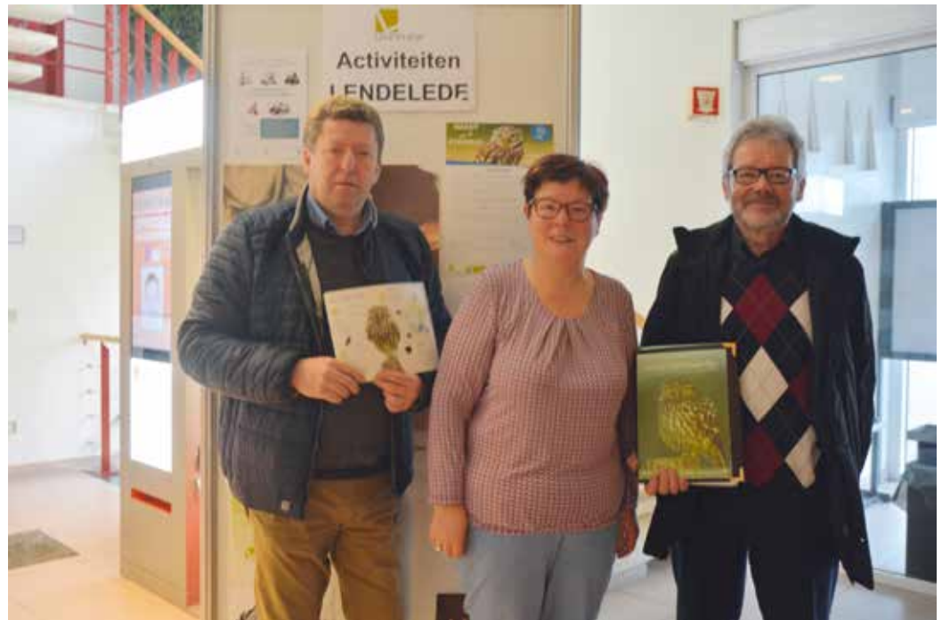
Nacht van de steenuil (25 maart 2017)