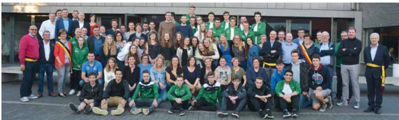
Sportkampioenen Lendeledede (19 mei 2017)